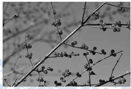
ハナヒョウタンボク

軽井沢町の準町花ハナヒョウタンボクが見頃です。赤い球形の果実が二つ並んでつく様子はヒョウタンのようにも見えます。