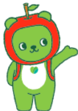
長野県PRキャラクター「アルクマ」 ©長野県アルクマ

抱えている悩みをどこに相談して良いか分からない時は、 こちらのウェブサイトをご覧ください。