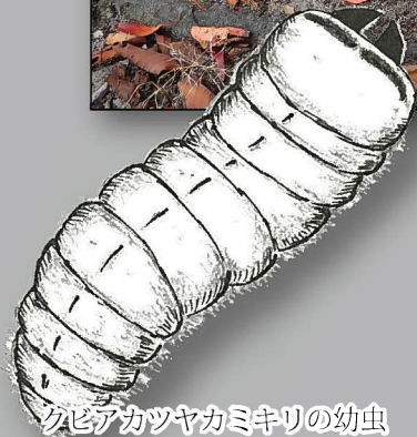
クビアカツヤカミキリの幼虫