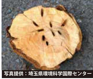
幼虫に食害された樹木の内部

公園や街路樹などのサクラ が加害されると 景観が悪化 し たり、 お花見を楽しむことが できなくな ってしまいます。