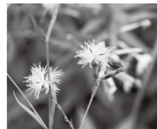
エゾカワラナデシコ