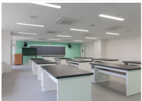
色分けされた特別教室 (理科室)

◇特別教室は、教科によって壁が色分けされており、生徒の授業に臨む切り替えスイッチとなるよう工夫しています。