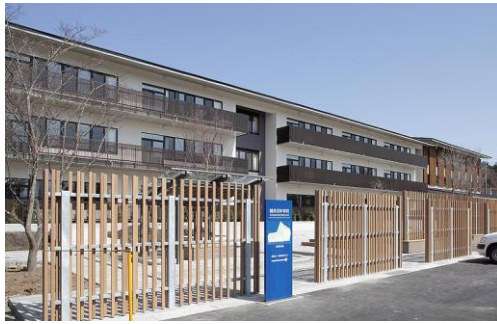
普通教室にある前庭

◇前庭は、生徒の送迎待機場所である東屋やステージ等、レクリエーションにも使える憩いの場となるよう整備しました。