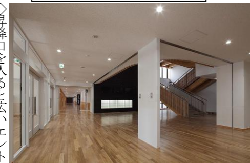
昇降口エントランス

◇昇降口を入ると広いエントランスがあります。自然エネルギーの表示モニターや、上階に繋がる階段、エレベーターがあります。