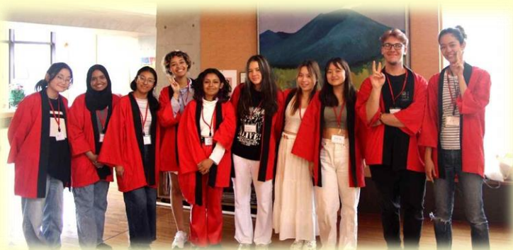
ボランティアで参加された UWC ISAK JAPAN（アイザック）の高校生

当日は、大勢の来場者を見込んでボランティアを募集したところ、長野大学、軽井沢高校、上田高校、アイザック