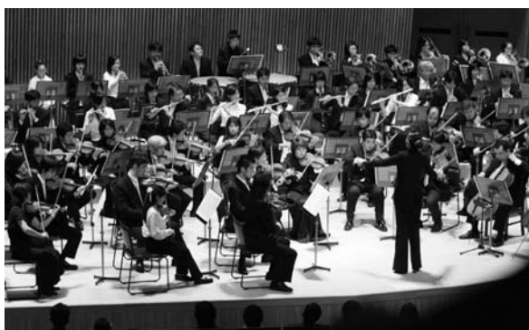
軽井沢大賀ホール