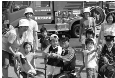
防火・救急のために 413円