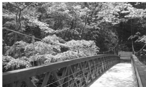
旧碓氷峠遊覧歩道の吊橋