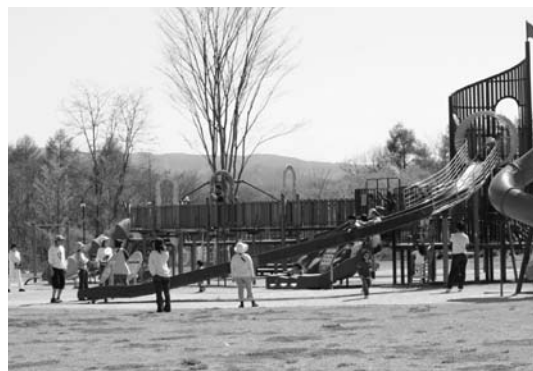
湯川ふるさと公園