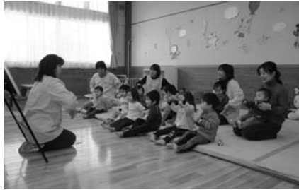
お年寄りや児童福祉に 1,712円