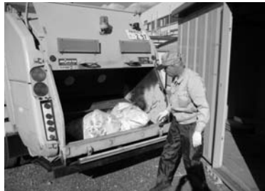
日常生活の環境整備に 968円