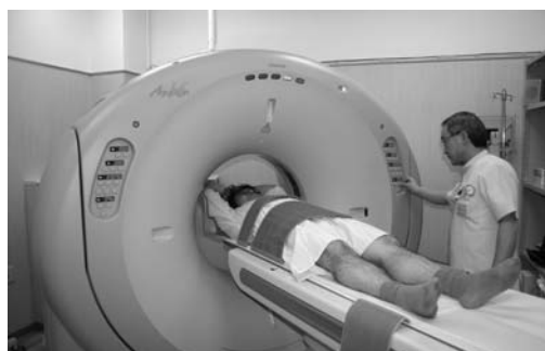
マルチスライス CT装置