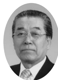
平成19年度 予算編成にあたり

平成19年度予算編成にあたっては、このような厳しい財政状況を踏まえつつ、「軽井沢町行政改革集中プラン」に基づく改革を着実に実施し、健全な財政運営を目指すとの基本的な考え方に立ち、限られた財源を重点的・効率的に予算配分することにより、最大の行政効果が得られるよう長期振興計画及び実施計画に基づき、健全財政の堅持に配慮した適正な予算編成を行いました。 での減収、横ばいの状況から若干の増加に転じておりますが、長期にわたる景気の低迷の影響で、本格的な回復には至っていないこと、また医療費をはじめとする福祉関係経費の増加など、町財政を取り巻く環境は極めて厳しい状況にあります。