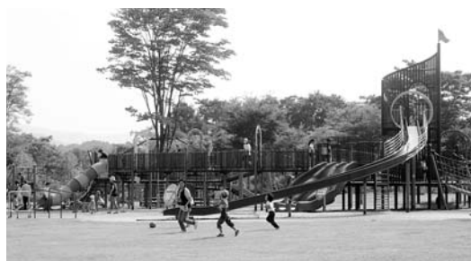
湯川ふるさと公園