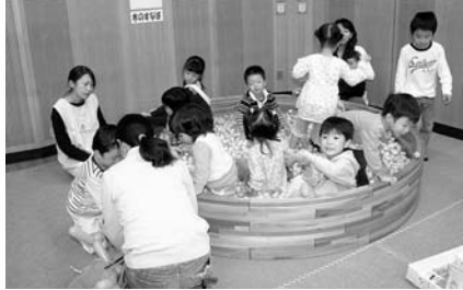
お年寄りや児童福祉に 1,803円