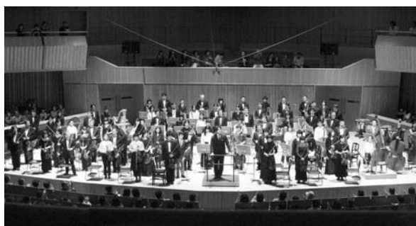
軽井沢大賀ホール