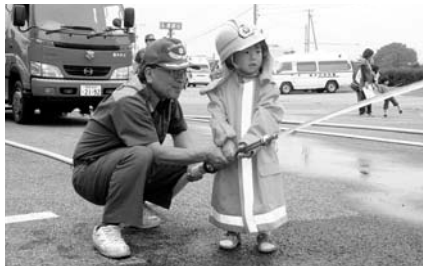
防火・救急のために 389円