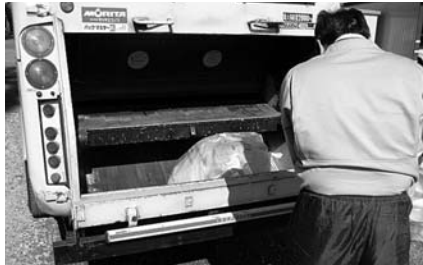
日常生活の環境整備に 894円