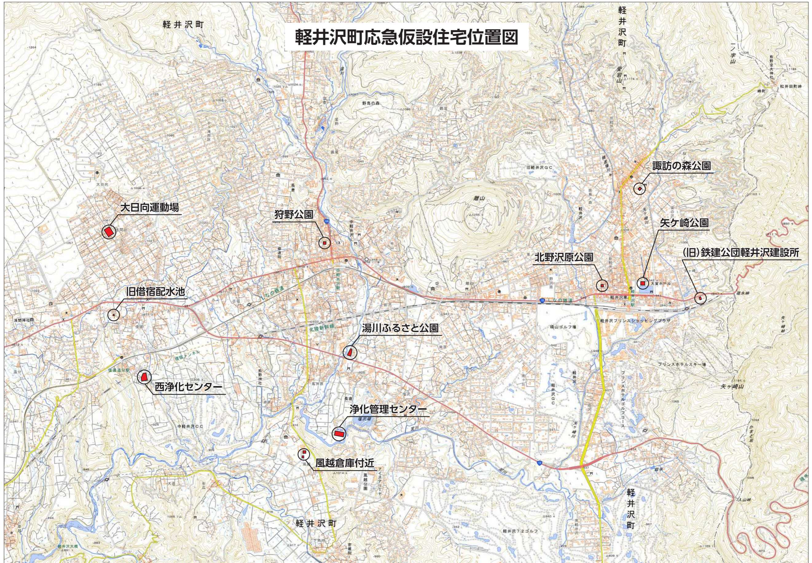
17-2 応急仮設住宅建設候補地位置図