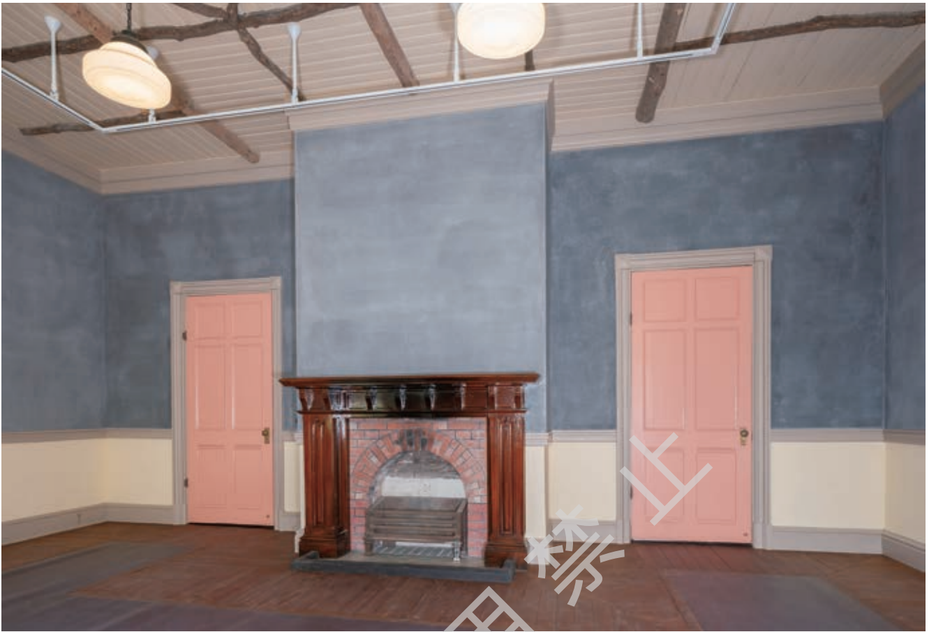
口絵5 竣工 ライブラリー 北西よりみる