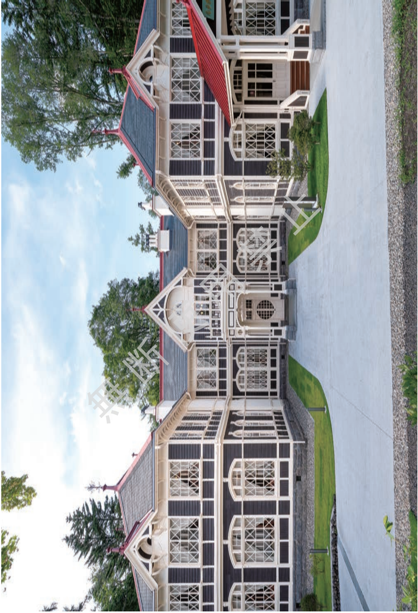
口絵 1 竣工 正面 南よりみる