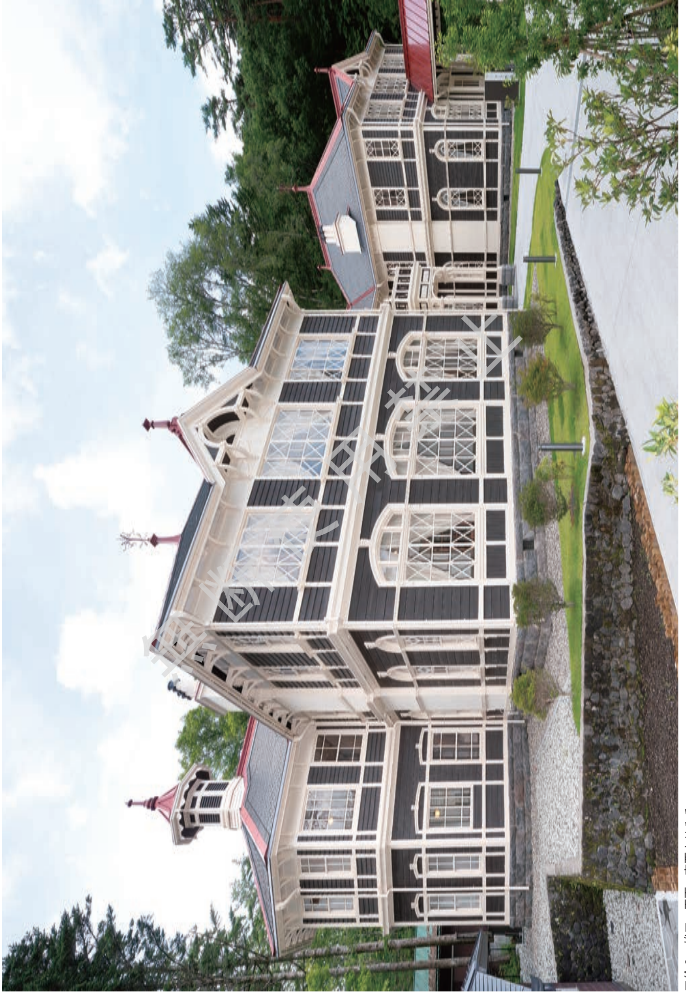
口絵2 竣工 正面 南西よりみる