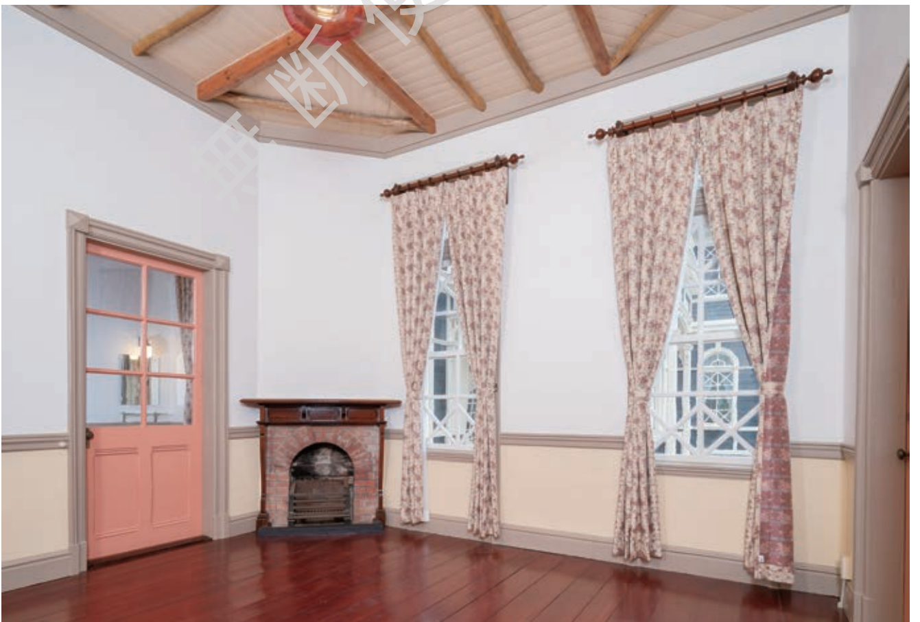
口絵6 竣工 客室No.18 南西よりみる