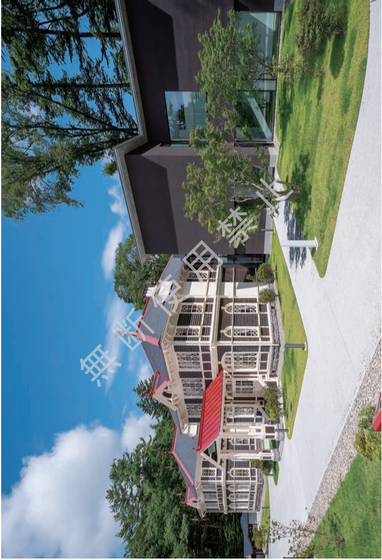
口絵 3 竣工 正側面 南東よりみる