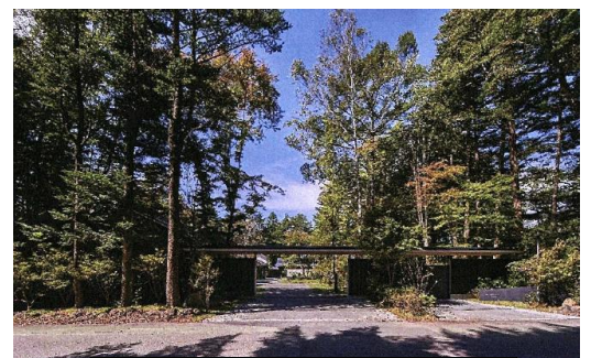
論点となった入口の門・ゲート