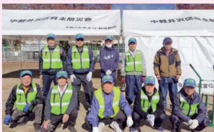
中軽井沢区自主防災会

中軽井沢区自主防災会、茂沢地区自主防災会、三ツ石地区自主防災会が公益財団法人長野県市町村振興協会の地域活動助成事業に採用され、助成金で防災備蓄資機材を整備しました。