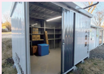
三ツ石地区自主防災会