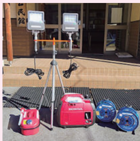
茂沢地区自主防災会