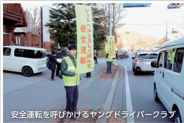
安全運転を呼びかけるヤングドライバークラブ

町と軽井沢警察署等は、12月1日に発生した電動キックボード利用者の死亡事故を受けて、事故発生場所の上ノ原交差点でドライバー等に安全運転や電動キックボードに乗る際のヘルメット着用を呼びかけました。