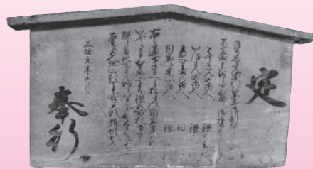
キリシタン禁令の高札 (江戸時代)