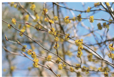
油がしぼれる? アブラチャン

町内にも自生し、本州、四 国、九州の明るい林等に見ら れる落葉低木です。4月頃、 淡い黄色の花をつけます。実 から油をしぼることも出来る そうです。名前は、実や樹皮 に油が多く、よく燃焼するこ とに由来するそうです。